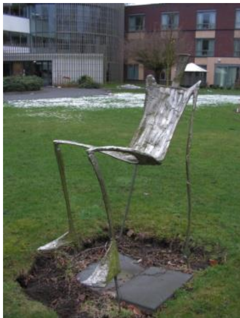
De weg terug